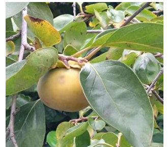
のどかな田畑を見ながら歩き、秋を見つけました